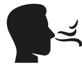
Reuk- en/of smaak- verlies

Heb je op dit moment een huisgenoot met milde klachten en koorts en/of benaauwdheid?